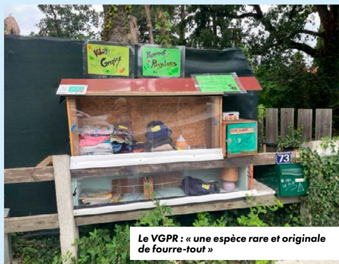
Le VGPR : « une espèce rare et originale de fourre-tout »