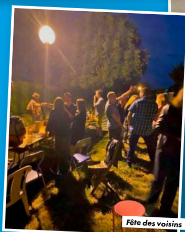
Fête des voisins

Saint Jean 2023 avec le Comité des fêtes d'Auzielle