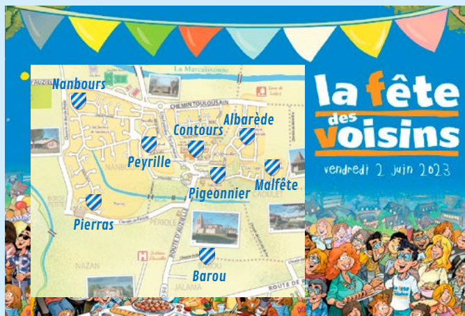
Le 2 juin, aux Contours, pour la « Fête nationale des voisins »