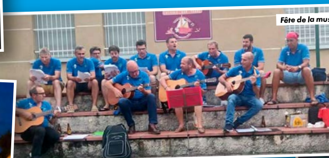
Fête de la musique