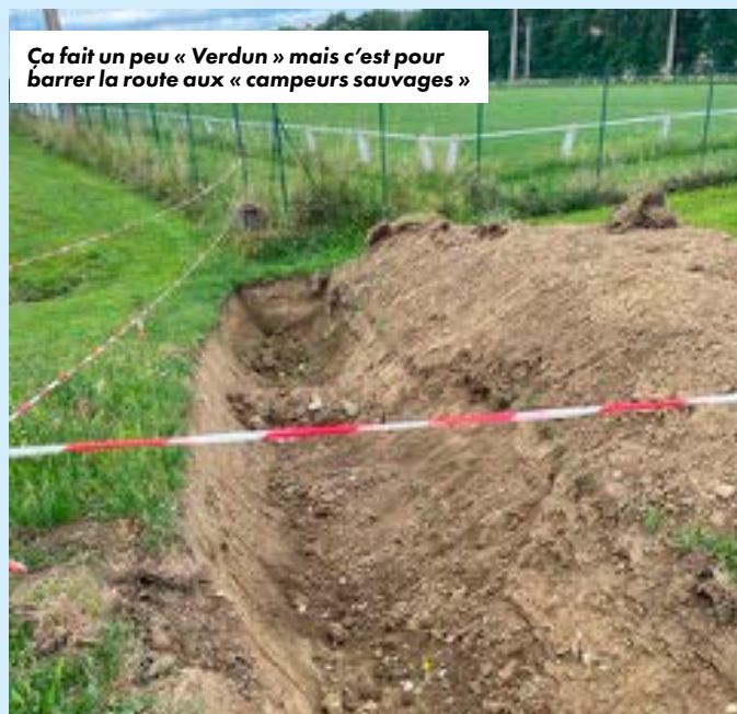
Ça fait un peu « Verdun » mais c'est pour barrer la route aux « campeurs sauvages »